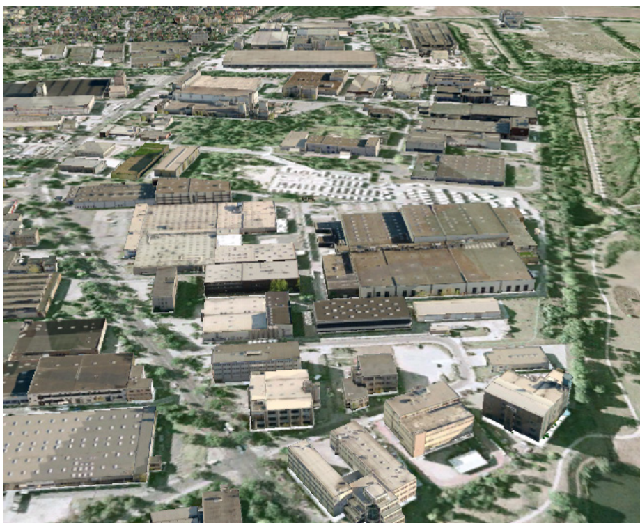
© Text: Mit freundlicher Genehmigung regioconsult