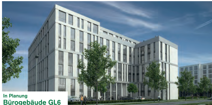
In Planung Bürogebäude GL6