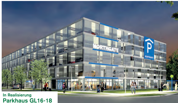
In Realisierung Parkhaus GL16-18