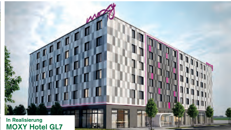
In Realisierung MOXY Hotel GL7