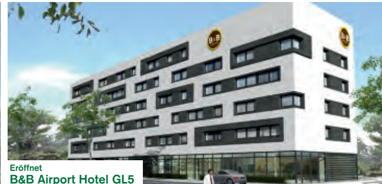
Eröffnet B&B Airport Hotel GL5